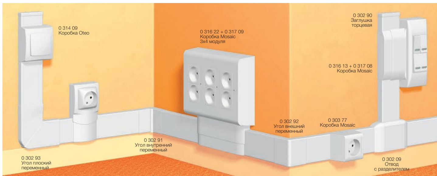
Таблица выбора стр. 870 Таблица емкости мини-плинтусов стр. 869