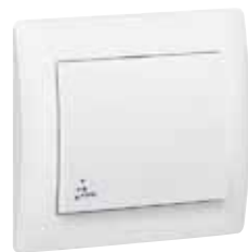
775 852 White