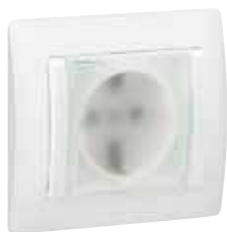
775 924 White